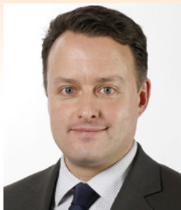
Sebastian Frehner, Nationalrat Basel-Stadt