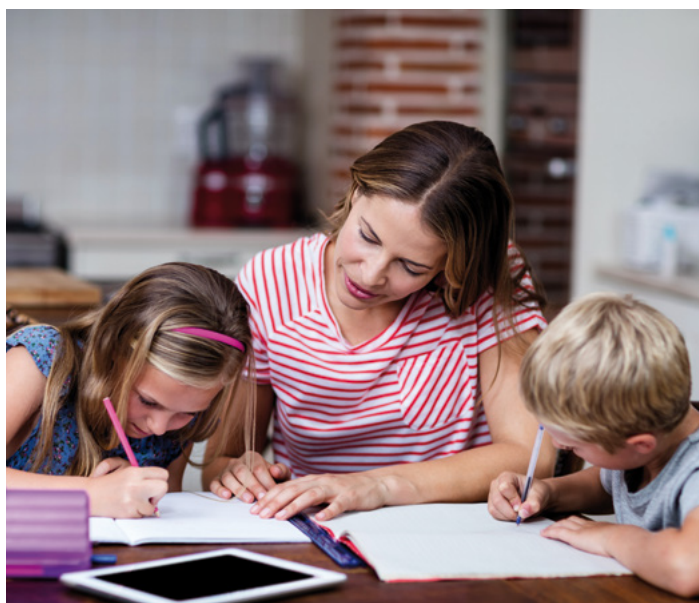
Eine Familie beim Hausunterricht

Mit über 500 respektive über 600 Schülern werden in den Kantonen Bern und Waadt die meisten Schüler schweizweit zu Hause unterrichtet. Danach folgen die Kantone Aargau und