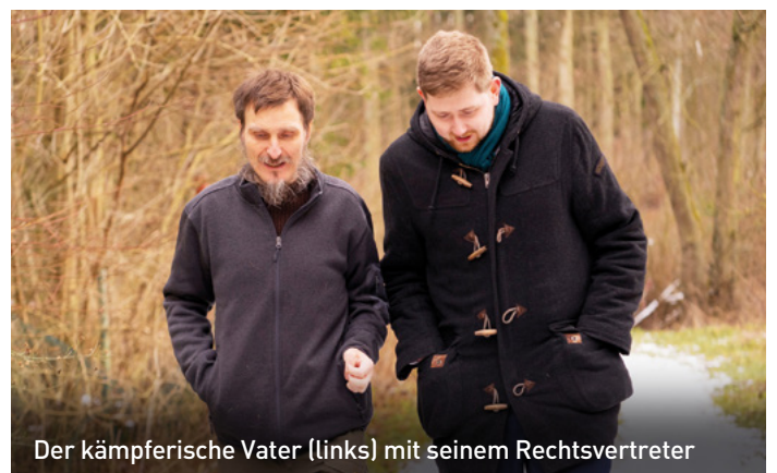
Der kämpferische Vater (links) mit seinem Rechtsvertreter