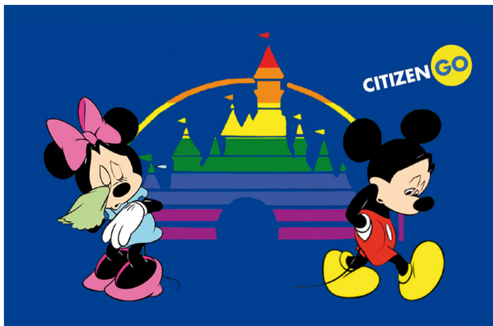
Minnie und Micky sind traurig (CitizenGO)

Die spanische Stiftung CitizenGO führt derzeit eine Online-Petition durch, welche sich an die Unternehmensleitung des Unterhaltungskonzerns Disney richtet. Dieser soll weitere Veranstaltungen zur «Feier, Darstellung und Bewerbung von Homosexualität» in den Disney Vergnügungsparks absagen. Der Verein Schutzinitiative bittet Sie, diese Petition 1 zu unterstützen.