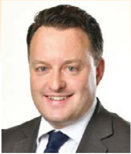
Dr. Sebastian Frehner, eh. Nationalrat Riehen (BS)