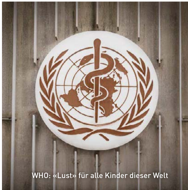
WHO: «Lust» für alle Kinder dieser Welt

brauchsbekämpfung, Thematisierung der Empfängnis und Schwangerschaft oder der Verhinderung von Krankheiten. Nein, es geht wohl vor allem um ein ideologisches Ziel: das staatlich zertifizierte vollkommene Sexualwesen gemäss WHO. Dagegen wehren wir uns. ■