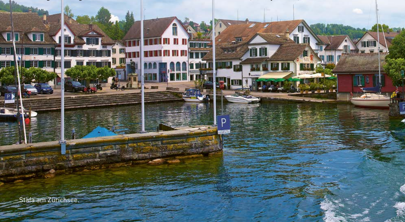
Stäfa am Zürichsee.

Wie systematisch diese gefährliche Ideologie verbreitet wird, zeigt die Tatsache, dass Pädagogische Hochschulen entsprechende Kurse anbieten. Die PH Zürich betreibt eine «LGBTQ-Weiterbildung». Sie wird folgendermassen angepriesen: «Lesbisch, trans, pan, agender, non-binär und genderqueer. Alles unklar? Mit dieser Weiterbildung für Schulleitende, Lehrpersonen, Schulsozialarbeitende und