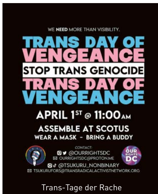
Trans-Tage der Rache