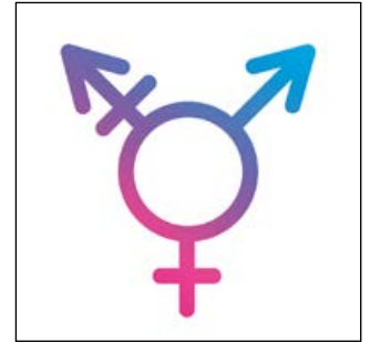
Transgender-Symbol auf Elternbrief.

Leider ist Stäfa kein Einzelfall, wie es auch in den Medien zu lesen war. Die Funktionäre der Genderideologie berufen sich auf den Lehrplan 21 und gehen systematisch auf die Kinder los – sogar schon auf die ganz kleinen! In Zürich haben kürzlich grotesk geschminkte und verkleidete Drag Queens Lesungen für kleine Knirpse veranstaltet. Weiter tourt das Theaterstück «Ich heisse Name» durch die Deutschschweiz. Es richtet sich schon an Kinder ab 5 Jahren und trichtert ihnen ein, man könne das Geschlecht wechseln wie die Socken. Im Bundeslager der Pfadfinder im vergangenen Sommer fand ein «Trans-Workshop» statt. Die Kinder und Jugendlichen werden also reihum angestiftet, an ihrer «Geschlechtsidentität» zuerst zu zweifeln und diese später sogar zu ändern.