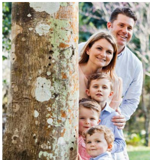
Die natürliche Familie: Tragende Säule der Gesellschaft