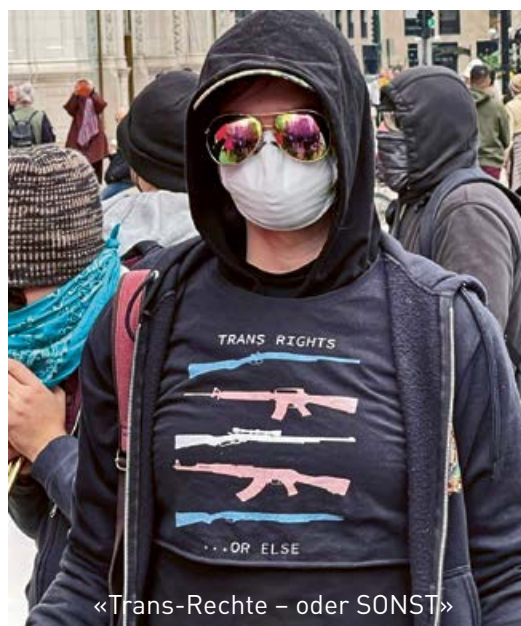
«Trans-Rechte – oder SONST»

Eine kanadische Studie 1 aus dem Jahr 2022 über College-Studenten ergab, dass «transsexuelle oder gender-diverse Jugendliche» die Gruppe mit dem höchsten Risiko für gewalttätige Radikalisierung seien. Auch zeige diese Studie, dass Personen mit Transsexualismus nach einer Geschlechtsumwandlung ein deutlich höheres Risiko für Mortalität, Suizidalität und psychiatrische Morbidität als die Allgemeinbevölkerung haben.