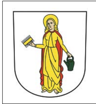
Gemeindewappen von Stäfa: Die heilige Verena mit Kamm und Krug.

Seit Wochen beschäftigt der Fall «Stäfa» Medien und Öffentlichkeit. Ein «Gendertag» wurde nach öffentlichen Protesten abgesagt. Doch die Gemeinde plant bereits weitere. Besonders stossend ist, dass auf der Einladung an Schüler und Eltern das Transgender-Symbol abgebildet war – der augenfällige Beleg dafür, dass unsere Volksschulen von der Transgender-Lobby unterwandert werden.