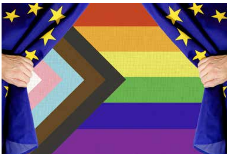
Die Transgender-Ideologie dringt immer tiefer in europäische Strukturen ein.

Germann (SVP) gegen die Resolution. Wir warten jedenfalls gespannt darauf, wann der nächste Vorstoss im Schweizer Parlament lanciert wird, um «Konversionstherapien» zu verbieten: Denn klar ist bereits heute: wir werden uns entschieden gegen ein solches «Konversionsverbot» einsetzen. ■