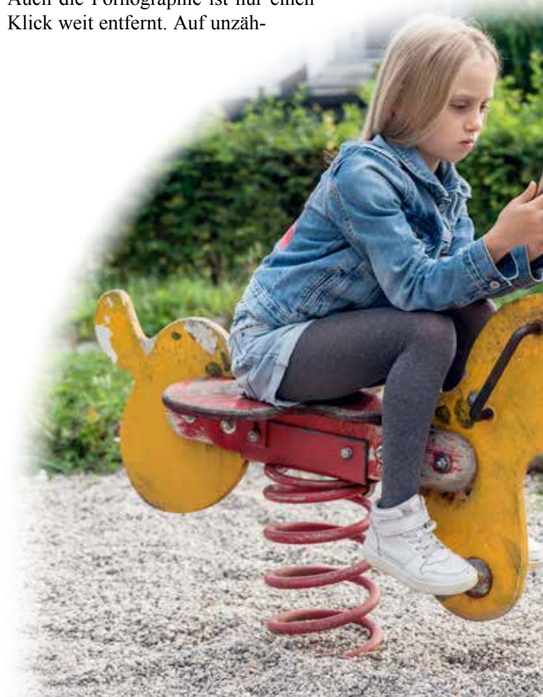
Die Abgründe des Internets als Kinderspielplatz.

Auch die Pornographie ist nur einen Klick weit entfernt. Auf unzäh-